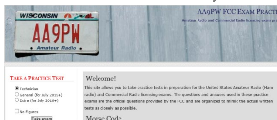
図2 書籍および模擬試験ホームページ

「W5YI-VEC 札幌試験チーム」によるFCC試験は、年間4回程度を計画しています。 試験日時については「(株) フェイズ・サッポロ」ホームページにてご確認ください。