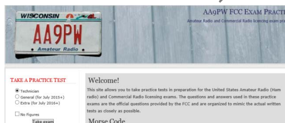
図2 書籍および模擬試験ホームページ

「W5YI-VEC 札幌試験チーム」によるFCC試験は、年間4回程度を計画しています。 試験日時については「(株) フェイズ・サッポロ」ホームページにてご確認ください。